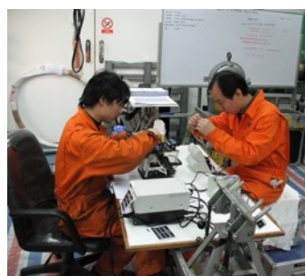
中英海底接续学校