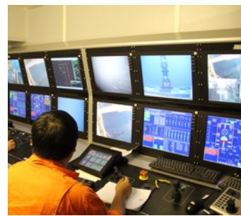
中英海底ROV培训学校